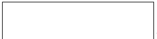
Схема границы эксплуатационной ответственности

Организация водопроводно- канализационного хозяйства