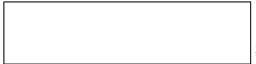
Схема границы балансовой принадлежности

д) границей эксплуатационной ответственности объектов централизованной системы водоотведения организации водопроводно-канализационного хозяйства и заказчика является: