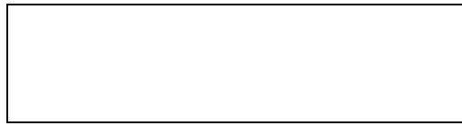
Схема границы эксплуатационной ответственности

Организация водопроводно- канализационного хозяйства